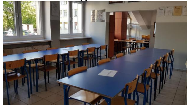
Zdjęcie nr 6