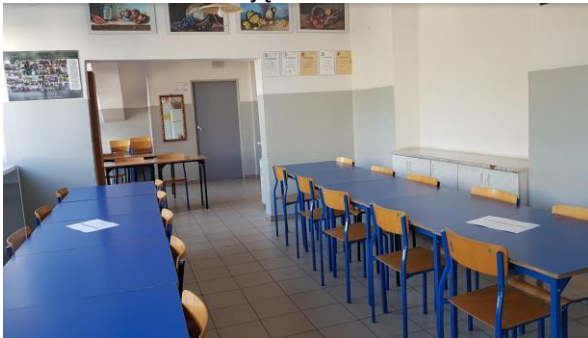
Zdjęcie nr 5