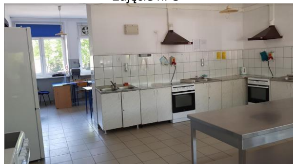
Zdjęcie nr 10