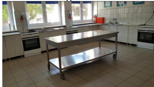
Zdjęcie nr 8