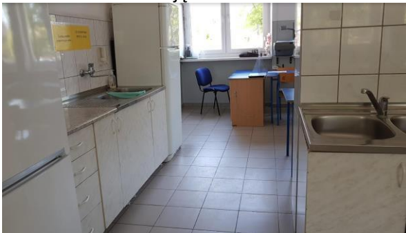
Zdjęcie nr 7