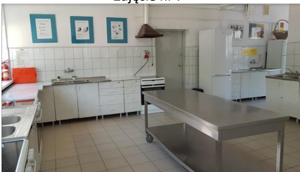
Zdjęcie nr 9